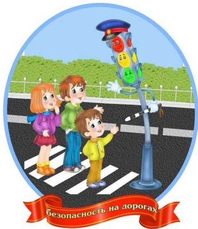
Памятка для детей